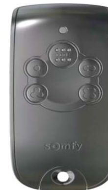
Keytis NS 4