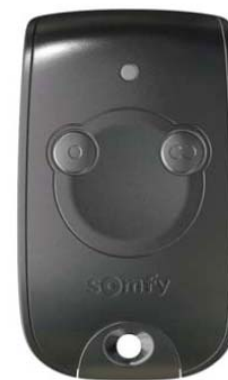
Keytis NS 2